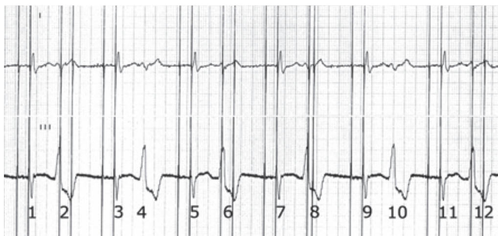
Figura 1. Registrazione simultanea delle derivazioni I e III.